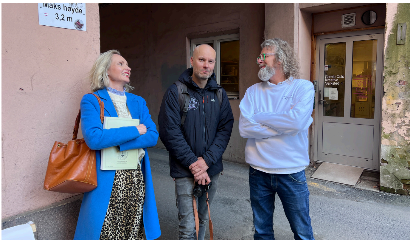
Bilde: Fra Miljømal sitt arrangement mai 2023