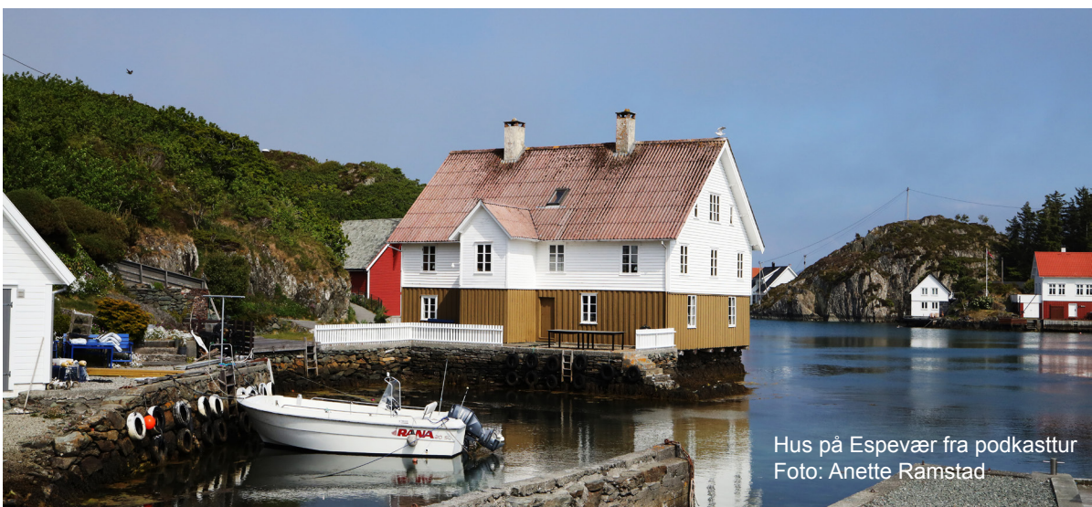
Hus på Espevær fra podkasttur