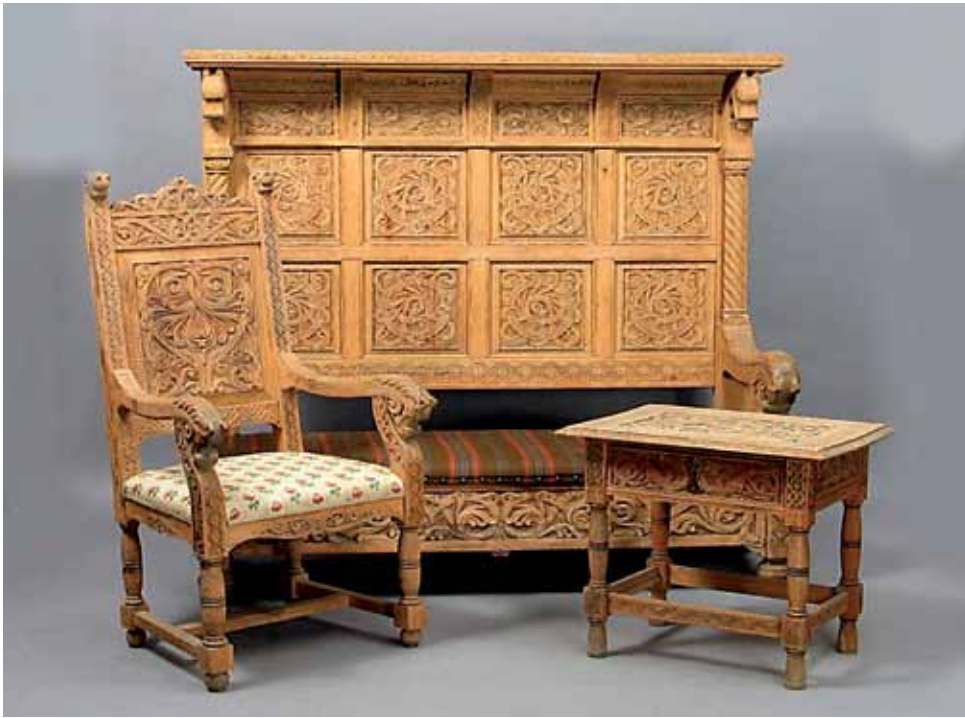
Over: Møblement med skåren dekor. Her ser vi at både dragene og dyrehodene fra den middelalderske «dyrestilen» er brukt, men også romanske søyler og akantusranker som ser ut som de kunne komme fra Gudbrandsdalen på 1700-tallet.