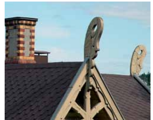
T.h.: Takdekor på dragestilsvilla, Mosseveien, Nordstrand Oslo. Legg også merke til de fine, pipene.