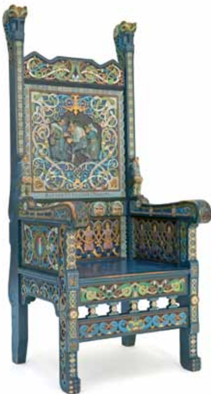
Over: Armstol, Lars Kinsarvik. Høy rygg formet med stort ryggbrett mellom to ryggstolper, alt avsluttet med fantasihoder. Rette armlener og ben.

Rikt skåret ornamentikk med tekstbånd, båndsløyger, ranker og geometriske mønstre. Bunnfargen er mørkeblå.