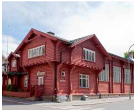
T.v.: Fredrikstad turnhall ble bygget som turnhall og foreningslokaler i 1899. Arkitekt er Ole Sverre fra Fredrikstad. Huset er bygget i laftet tømmer og, har en utkraget annen etasje. Dessverre ble endel opprinnelige dragestilsdetaljer fjernet ved ombygginger på 1900-tallet. Bygningen har buede vinduer, typisk for dragestilen i annen etasje.