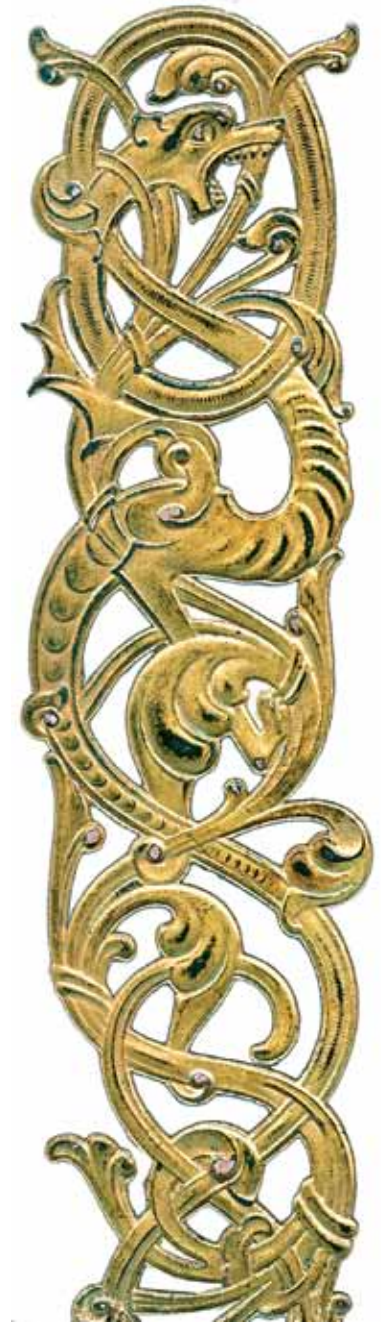
T.h.: Dekor fra forsiden på et gammelt postkortalbum, fra tidlig 1900-tallet. Tydelig inspirert av dekoren på den tidligere omtalte portalen ved Urnes stavkirke.