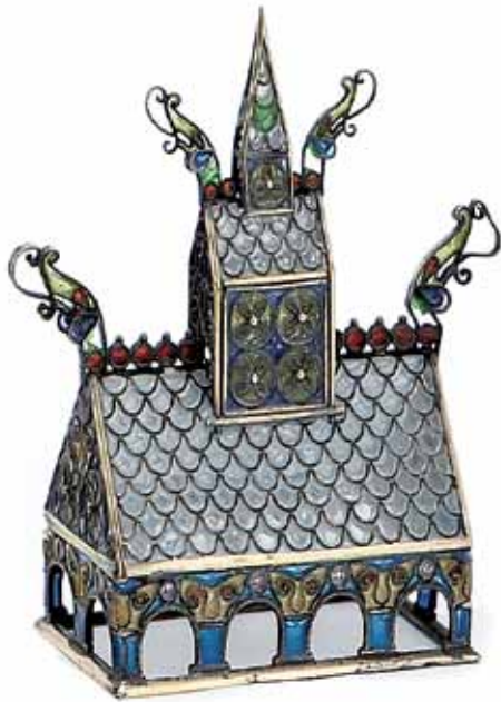
Stavkirkemodell i sølv og vindusemalje. Ingen stempler, men den kan vel ikke være noe annet enn norsk?